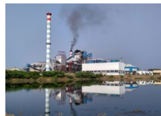
Pollution de l'air et des eaux