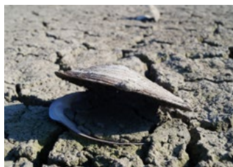
Augmentation des températures